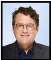
BERNARD DRAINVILLE Député Lévis