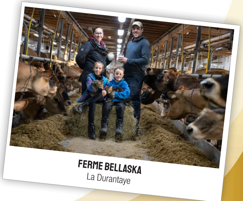
FERME BELLASKA La Durantaye

8147kg (275-276-297) 13 EX, 32 VG & 6 GP