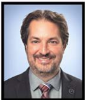
MATHIEU RIVEST Député Côte-du-Sud