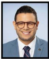
SAMUEL POULIN Député Beauce-Sud