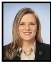
STÉPHANIE LACHANCE Députée Bellechasse