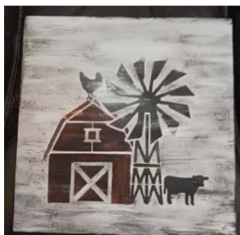
ITEM #17 Art mix média Mixed Media Art