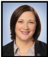
ISABELLE LECOURS Députée Lotbinière-Frontenac

Et nous sommes heureux d'y participer à notre manière.