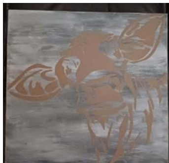
ITEM #22 Art mix média Mixed Media Art

Découvrez les items qui seront mis en vente/ Items available for bidding