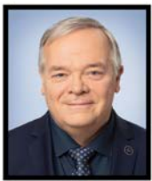
LUC PROVENÇAL Député Beauce-Nord

C'est avec grand plaisir que nous accueillons cet événement d'importance dans notre région.