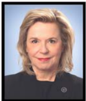
MARTINE BIRON Députée Chutes-de-la-Chaudière