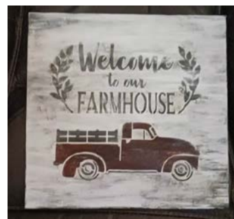
ITEM #18 Art mix média Mixed Media Art