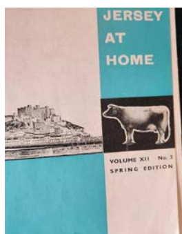
ITEM #14 Jersey At Home - 1968/1969