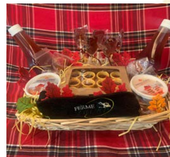
ITEM #21 Produits de l'érable Maple delight