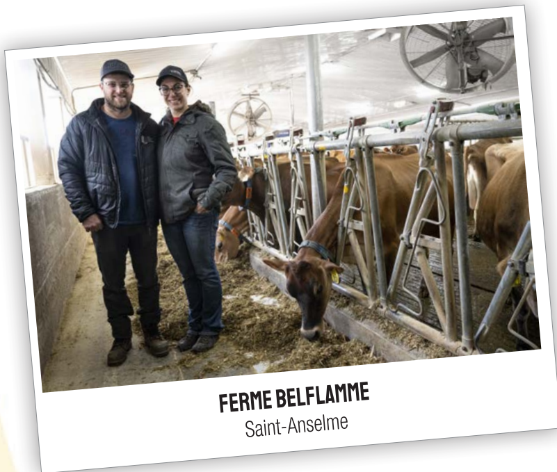
FERME BELFLAMME Saint-Anselme

Si vous souhaitez visiter les fermes par vos propres moyens, nous vous invitons néanmoins à respecter les heures de visites. If you wish to visit the farms on your own, please respect the visiting hours posted here.