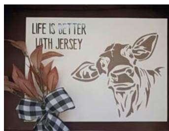
ITEM #19 Art mix média Mixed Media Art