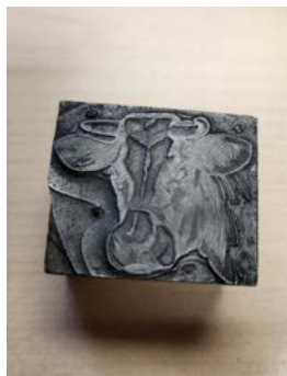
ITEM #20 Lot de 4 étampes vintage Set of 4 vintage stamps