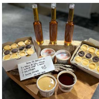
ITEM #16 Produits de l'érable Maple delight