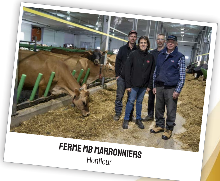
FERME MB MARRONNIERS Honfleur

8003Kg (274-269- 266) 4 EX, 21 VG & 43 GP