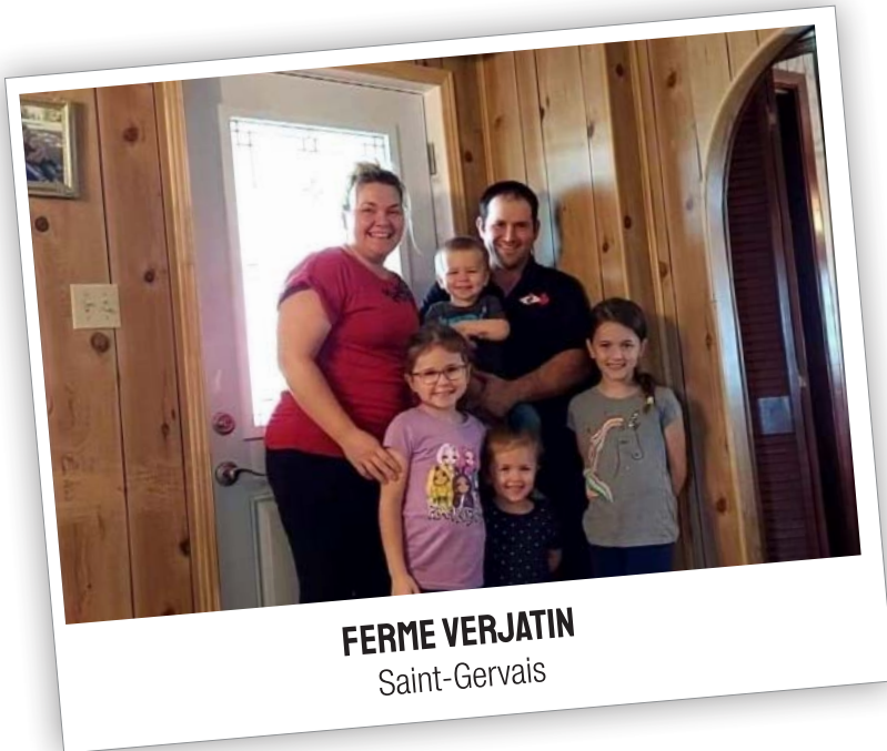
FERME VERJATIN Saint-Gervais

Si vous souhaitez visiter les fermes par vos propres moyens, nous vous invitons néanmoins à respecter les heures de visites. If you wish to visit the farms on your own, please respect the visiting hours posted here.