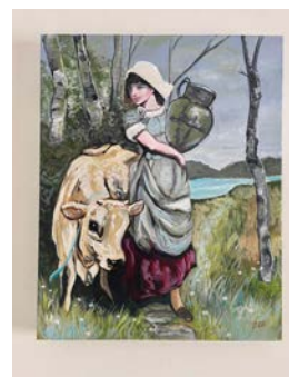
ITEM #15 Toile Jersey Jersey painting